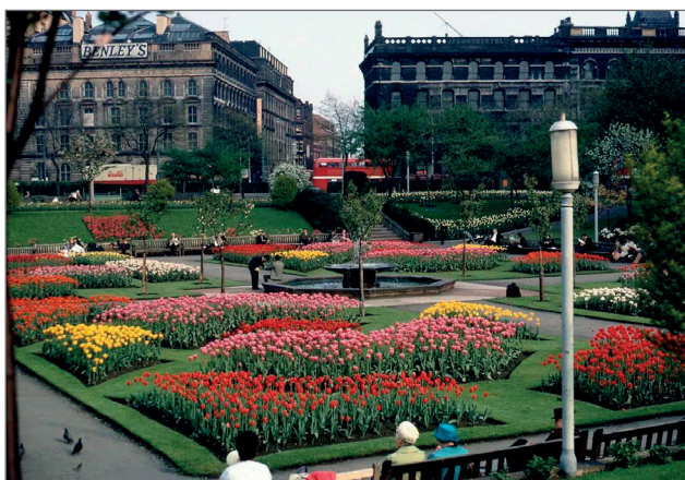
Рис. 2. Сады Пикадилли, Манчестер. 1960 г.

Когнитивный компонент содержит общую характеристику места и факторов, которые влияют на жизнь города: демографический, экономический и социально-политический. К общим характеристикам относятся его удаленность от центра, ландшафтно-климатические особенности, развитие транспортной сети, а также его местоположение в стране, которое играет важную роль в развитии города и определяет его привлекательность для жизни.