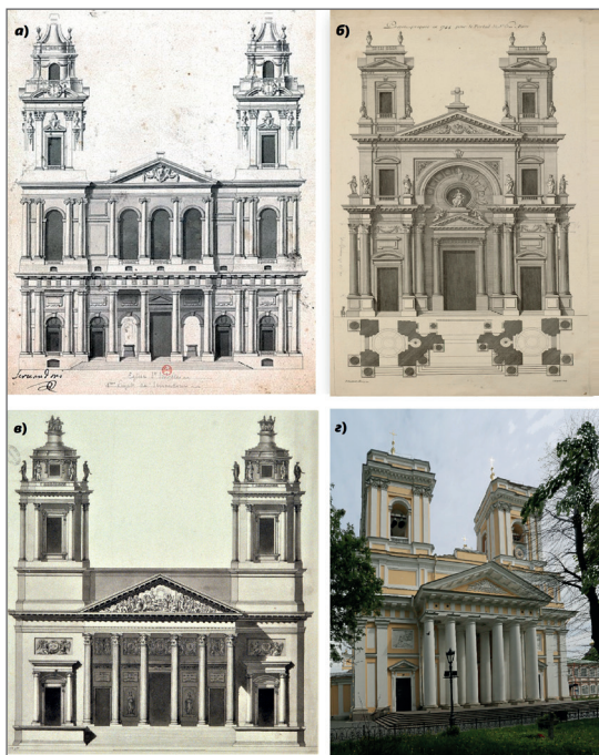
Рис. 1. Троицкий собор И. Старова и его архитектурные прототипы – проекты двухколоколенных храмов Парижа второй трети XVIII века: а) Дж. Сервандони. Проект церкви Сен-Сюльпис. Париж; б) П. Контан де Иври. Проект церкви Мадлен. Париж; в) Ж.-А. Раймон. Конкурсный проект на «Римскую» премию. 1766 г.; г) И. Старов. Троицкий собор.

Тема двухколоколенного храма в Петербурге этого периода отмечена серией ярких классицистических ансамблей. Это доказывают сохранившиеся первоначальные проекты Ж.-Б. М. Валлен-Деламота [6, с. 327–330] и работы П. Е. Егорова 1 , Г. Фельтена, Дж. Кваренги, Л. Руска, Ж.-Ф. Тома де Томона и других мастеров. За пределами столицы широкое распространение этого типа церковного строительства заметно во владениях русской аристократии. Архитектурная политика Екатерины II и ее толерантность определяла разнообразие произведений. К приезду императрицы владельцы загородных усадеб стремительно воздвигали нарядные храмы, парадные фасады которых были украшены парными колокольнями, воспроизводя тему парадных триумфальных ворот. С учетом состояния заказчиков, храмы могли возводить как небольших, так и гигантских габаритов. Планировка также отличалась разнообразием: от лаконичных ротонд до крупных базиликальных типов.