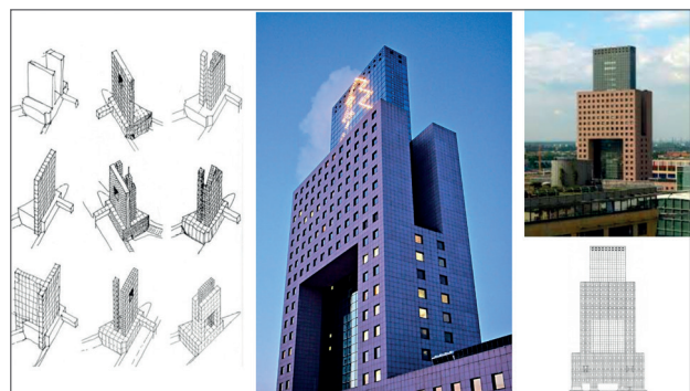
Рис. 3. Офисная башня ярмарки во Франкфурте-на-Майне Торхаус, или Дом-Ворота (1989–97)