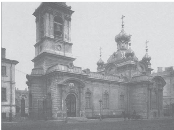
Рис. 2. Храм Захарии и Елизаветы Кавалергардского полка в Санкт-Петербурге. Арх. Л. Н. Бенуа.