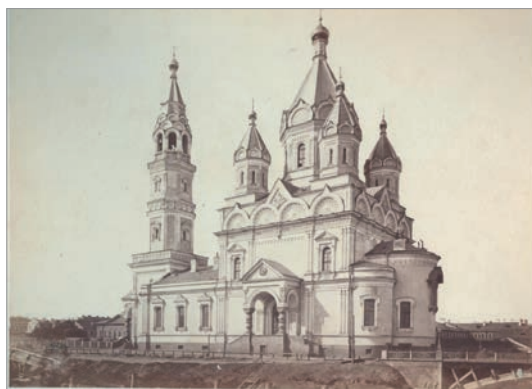
Рис. 1. Храм лейб-гвардии Егерского полка в Санкт-Петербурге. Арх. К. А. Тон.

Храм Захарии и Елизаветы, построенный в 1753 году, стал полковой церковью для воинов Кавалергардского полка (рис. 2). В конце XIX века архитектор Л. Н. Бенуа разработал проект церкви в стиле барокко, изменяя даже план здания, который приобрел форму греческого креста. С начала 1920-х годов церковь стала центром обновленчества, но в 1935 году она была закрыта по решению Ленсовета. Позже здание было переделано под спортзал и в 1948 году полностью снесено, уступив место корпусу Военного инженерно-технического университета.