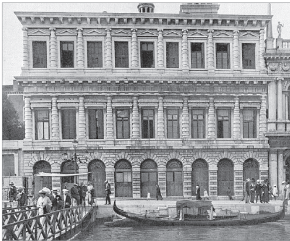
Рис. 6. Сансовино. Цекка

Наконец, в творчестве Бернардо Буонталенти, самого молодого из триады (1536–1608), до своего наивысшего расцвета доходят несколько чисто маньеристических архитектурных идей.