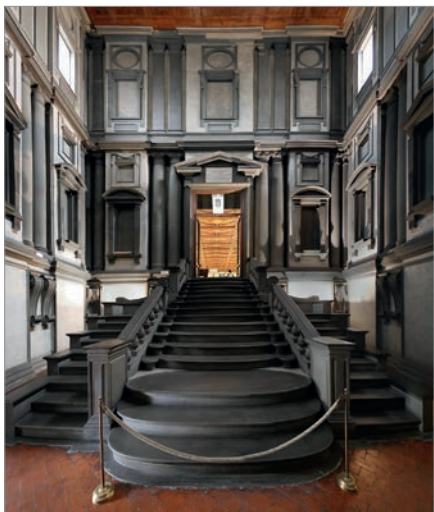
Рис. 4. Микеланджело. Лаурентийская библиотека

При этом нельзя сказать, что герцогство совсем не чувствовало дух нового времени до прихода триады. Но постройки носили явный утилитарный характер. Яркий пример – Фортецца да Бассо 1534 года, в каменной кладке которой чередуются привычные для кварточенто «бриллиантовые» блоки и более фантазийные «яйцеобразные» вставки. То есть плавно наблюдается художественное переосмысление чисто функционального конструктивного элемента – руста. Данный пример, пожалуй, можно объяснить только понятием Zeitgeist («дух времени»).