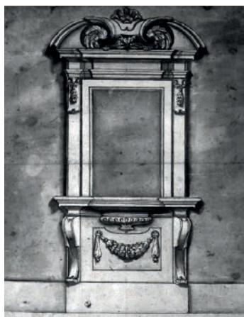
Рис. 3. Буонталенти. Палаццо Нонфинито. Эскиз окна