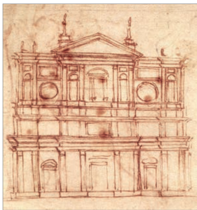
Рис. 1. Микеланджело. Сан-Лоренцо

щение тесноты, а лестница буквально «изливается» в вестибюль, не столько приглашая вошедшего подняться в читальный зал, сколько отнимая у него пространство в самом вестибюле. Интересно, что данное решение используется не только для визуального эффекта: лестница возникла из-за требования церкви организовать в читальном зале боковой свет, – поэтому пришлось поднять пол, а колонны встроить в стену из-за слабости существующих фундаментов и невозможности выполнить ордерный декор, приставленный к стене. То есть в данном случае маньеризм Микеланджело – это не только абстрактная «архитектурная картина»: в ней присутствует рационализм, интерпретированный посредством яркой сценографии.