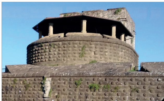
Рис. 5. Фортецца да Бассо

Именно благодаря проникновению таких незначительных примеров в архитектурную действительность герцогский двор был готов после стабилизации своего положения к масштабным экспериментам новой архитектуры, для прославления себя как изысканной и просвещенной власти, с собственным поражающим стилем, который и создала великая триада, следовавшая примеру своего учителя.