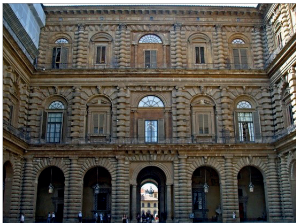
Рис. 7. Амманнати. Палаццо Питти

Руст Буонталенти, в отличие от экспериментов Амманнати, уже носит не конструктивный, а гротескный характер, что наглядно раскрывается в парковых павильонах, «гротах» садов Боболи и Пратолино. Вместо четких блоков архитектуру опоясывают «окаменелости морской губки», своды «обрастают» сталактитами – архитектура уже буквально копирует природу, создавая не только зрелищный и театральный образ, но и первый с начала Нового времени (задолго до экспериментов К.-Н. Леду) прецедент безордерной архитектуры. Генезис данного решения – сложный вопрос, но очевидно вдохновение порталами из книги С. Серлио и воля заказчиков, желавших получить пространства из античных мифов для светского времяпрепровождения на природе.