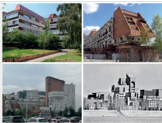
Рис. 2. Слева-направо: жилые дома Иргиредмета; Галерейный дом на просп. Маршала Жукова; Комплекс общежитий Пединститута с офисным центром; Дом служащих ВСЖД