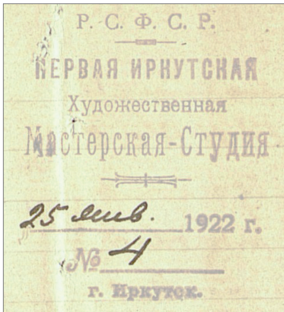
Рис. 2. Штамп Первой Иркутской художественной мастерской-студии 1922 г. [7, Л. 25]

В связи с укреплением школы Копылов весной 1914 г. планирует ее реорганизацию – разрабатывает «целый план создания Организованной свободной художественной школы, обслуживающей громадный район Восточной Сибири» [7, Л. 12-12об.]. План был рассчитан на 15-20 лет и предполагал создание при существующей школе библиотеки, музея учебных материалов (репродукций, костюмов, предметов обстановки) и, «как завершение, постройку собственного здания для школы, специально приспособленного для потребностей обучения искусству» [7, Л. 12об.]. Первая мировая война разрушила эти планы: «многие учащиеся были мобилизованы и погибли на фронте, самому руководителю в течение всей войны грозила мобилизация» [7, Л. 12об.]. Но идея Свободной художественной школы Восточной Сибири не была забыта: в отчете за 1923 г. Копылов выражал надежду, что благодаря поддержке советской власти школа «досуществует до того момента, когда мечты, разрушенные империалистической войной, претворятся в действительность» [7, Л. 20об.].