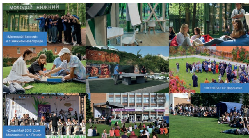
Рис. 3. Молодежные пространства открытого и закрытого типа