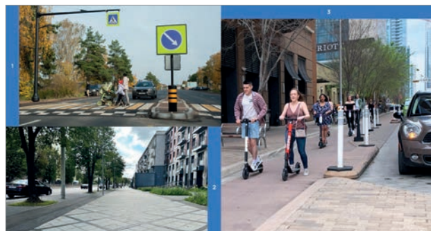
Рис. 2. Организация пешеходных пространств

Развитие городских общественных пространств, адаптированных к потребностям пожилых людей, не только повысит качество жизни старшего поколения, но и способствует формированию более инклюзивной и дружественной городской среды для всех горожан. Создание таких пространств – это инвестиции в будущее города, которые сделают его более удобным и пригодным для жизни различных возрастных категорий.