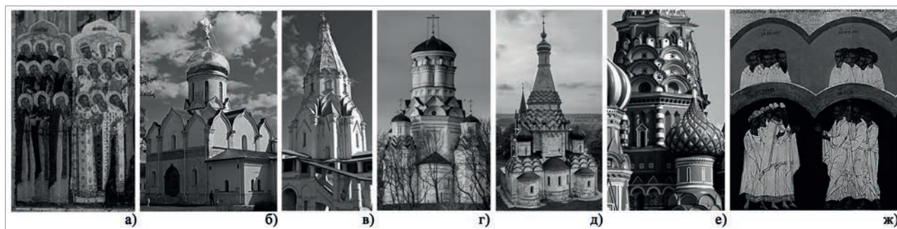
Рис. 2. «Животворящий столп», дополненный на фасаде килевидными закомарами и кокошниками в образ «пламенеющей» «непрестанной» молитвы, предстоящих перед Иисусом Христом: Пресвятой Богородицы, святых и праведников: а) изображение «пламенеющей» молитвы святых. Фрагмент иконы «Неделя Всех святых», нач. XVII в., из церкви Воскресения Христова с. Кишерть, Пермская государственная художественная галерея; б) собор Рождества Пресвятой Богородицы в Саввино-Сторожевском монастыре, 1398 г., Звенигород, МО; в) церковь Вознесения в Коломенском, 1532 г., Москва; г) церковь Усекновения главы Иоанна Предтечи в селе Дьякове, 1529-80 гг., МО; д) церковь Спаса-Преображения в селе Остров, XVI в., Московская область; е) фрагмент круглых и килевидных кокошников в соборе Покрова Пресвятой Богородицы на Рву, 1561 г., Москва; ж) изображение святых под сенью, «покровом» на фрагменте иконы «Неделя Всех святых» из церкви Всех святых в Ростове, вторая половина XVI в., г. Ростов, Государственный музей-заповедник «Ростовский Кремль»

В XVI веке вышеупомянутое молитвенное пламя во внешнем облике устремляется высь, охватывая весь объем церкви. Так, образ «Животворящего столпа» составляет уже всю постройку, например, в церкви Вознесения в Коломенском (рис. 2 в). Позже «Животворящий столп» в решениях фасадов многостолпных храмов до-